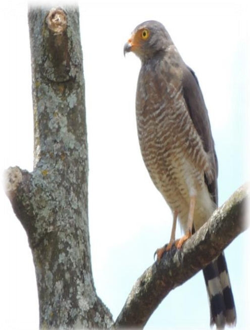
Gavián caminero Rupornis magnirostris