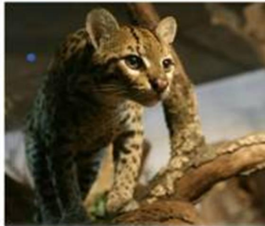
Ocelote - Leopardus pardalis