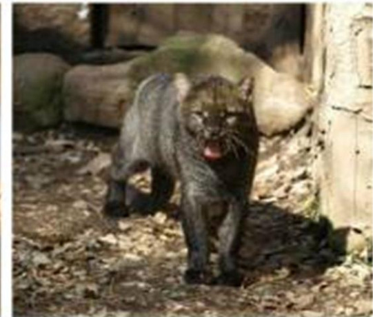
Yaguarundi - Puma yagouaroundi