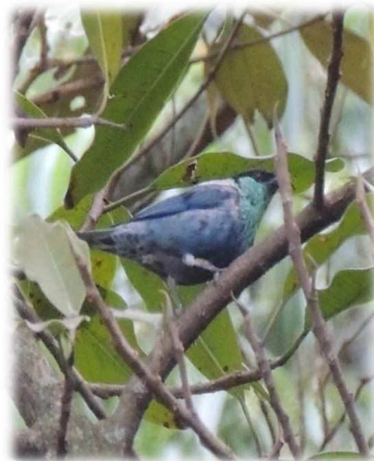
Tángara capiroxada Tangara heinei