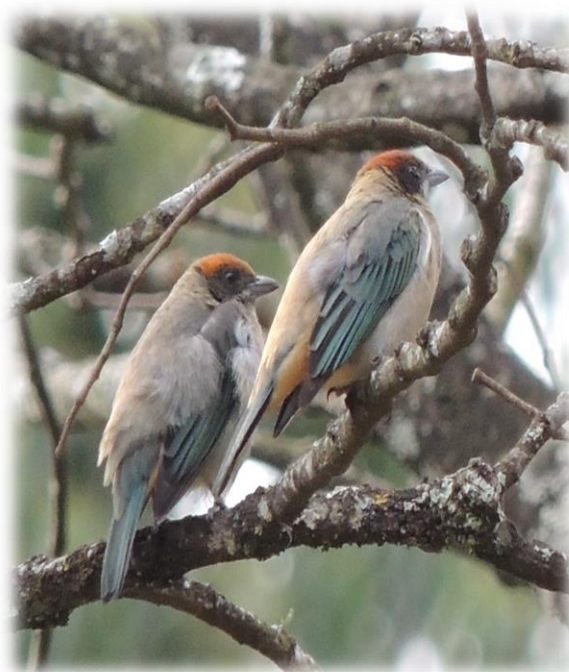
Tángara rastrojera Tangara vitriolina