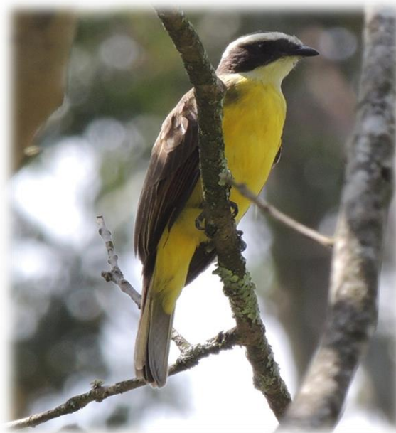
Suelda social Myiozetetes similis