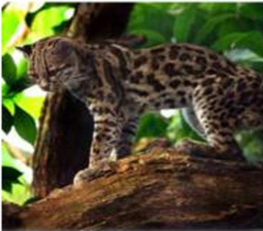
Margay – Leopardus wiedii