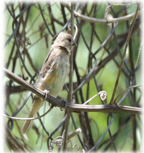
Espiguero capuchino Sporophila nigricolis