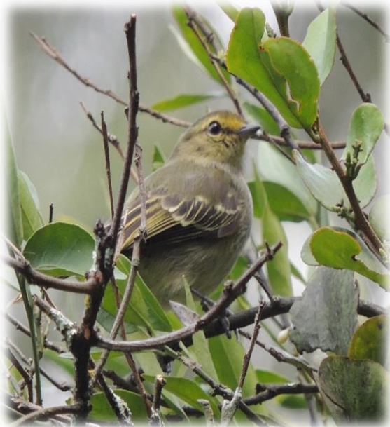
Mosquerito caridorado Zimmerius chrysops